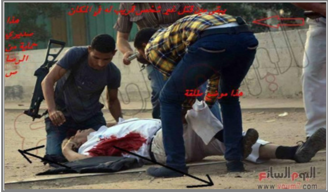
الصورة توضح بعض الملابس!