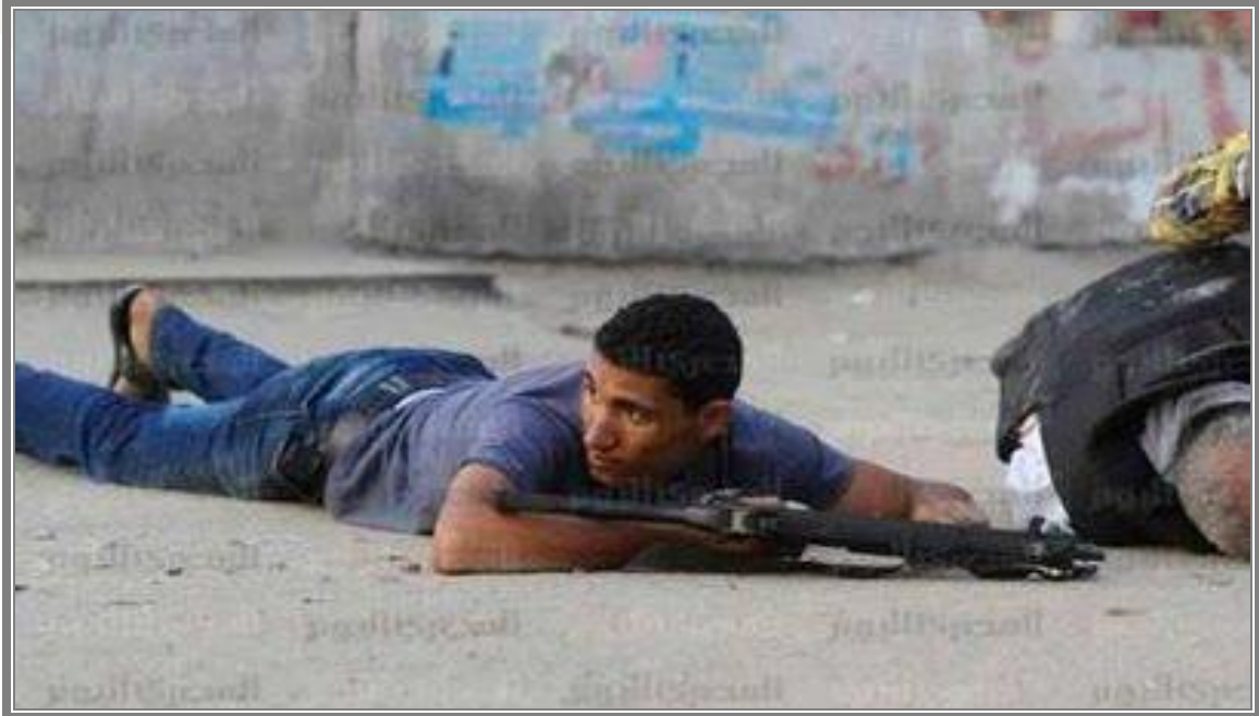
"بلطجي" بجانب اللواء القتيل